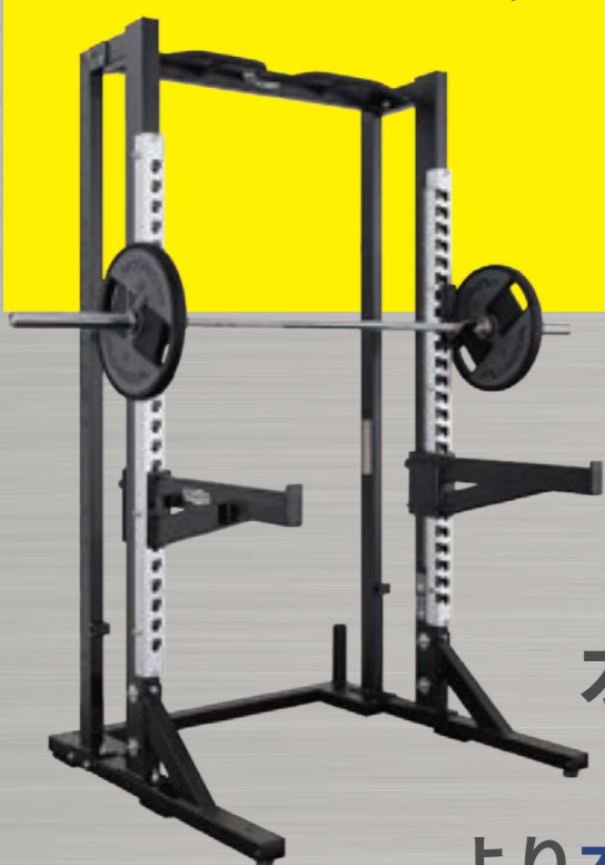
オリンピックハーフ