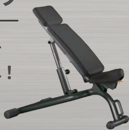
アジャスタブルベンチ